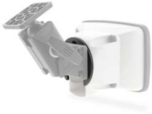
Beispiele: Adapter für Wachendorff

Um die Verbindung zwischen dem BIGmount und dem montierenden Gerät zu gewährleisten, bieten wir die verschiedensten Adapterplatten an. Diese Adapter werden mit den beiliegenden Schrauben auf die Basisplatte des BIGmount geschraubt. Sollten wir Ihre Adaptionmöglichkeit nicht im Sortiment haben, sprechen Sie uns an. Gerne fertigen wir nach Ihren Vorgaben eine entsprechende Lösung.