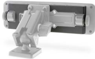
Adapter für Motorola