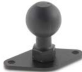
Basiskugel mit Trapez