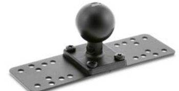
Schraubadapter mit Basisplatte