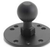
Basiskugel mit Flansch, rund