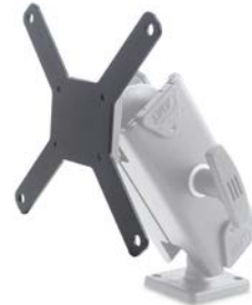
Adapter für LUIS