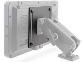
Adapter für VESA

Die Montagehilfen sind in verschiedenen Ausführungen erhältlich. Gewindestift, Trapez- und Rundflansch, verschiedene Lochbilder und angepasst an Armaturen sind nur einige der Ausführungen. Bei Bedarf bieten wir Ihnen gerne eine speziell nach Ihren Vorstellungen angepasste Montagehilfe an.